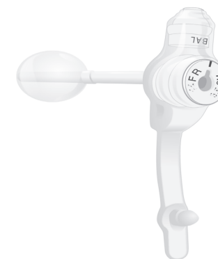
Mic-Key sidder helt tæt til huden og er uden slange på maveskindet

På www.mic-key.dk kan du se en animeret film om brug og pleje af Mic-Key. Du kan også downloade en app til din telefon eller iPad, så du altid har Mic-Key brugertips lige ved hånden.